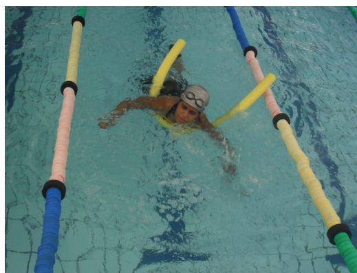
Figura 4. Conversa com a água.