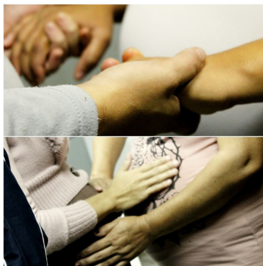
Figura 3. Toques e trocas entre as participantes do grupo.

Além disso, é possível promover ações em conjunto com outros profissionais e outros setores para se ampliar todos os olhares do campo da saúde para uma atenção mais integrada e transversal; incluir os